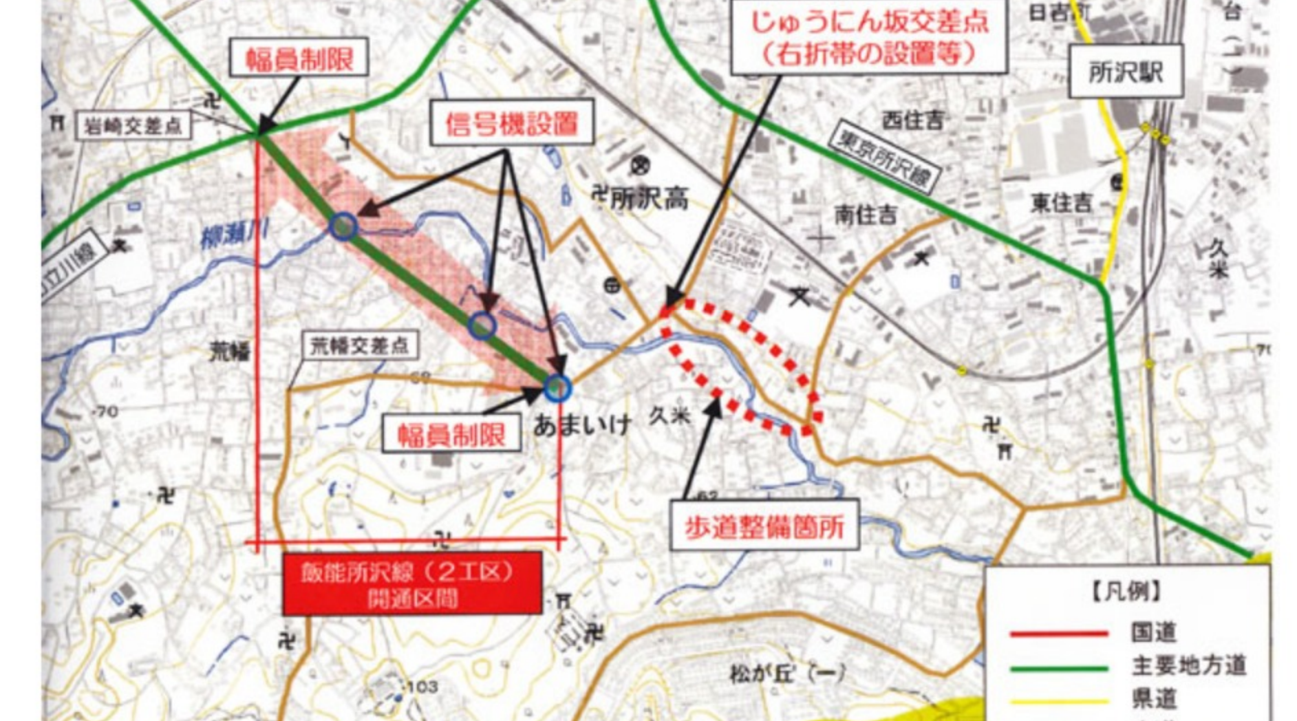
<飯能所沢線の暫定開通>

2015年4月に、飯能所沢線が岩崎交差点からスーパーあまいけ前まで2車線で暫定開通する予定です。暫定開通により、松が丘中央通りの通過交通量が増え、松が丘西・東交差点の渋滞で通勤時間の増加、中央通り住宅の振動・騒音・排ガス被害の増加、交通事故の増加が予想されます。