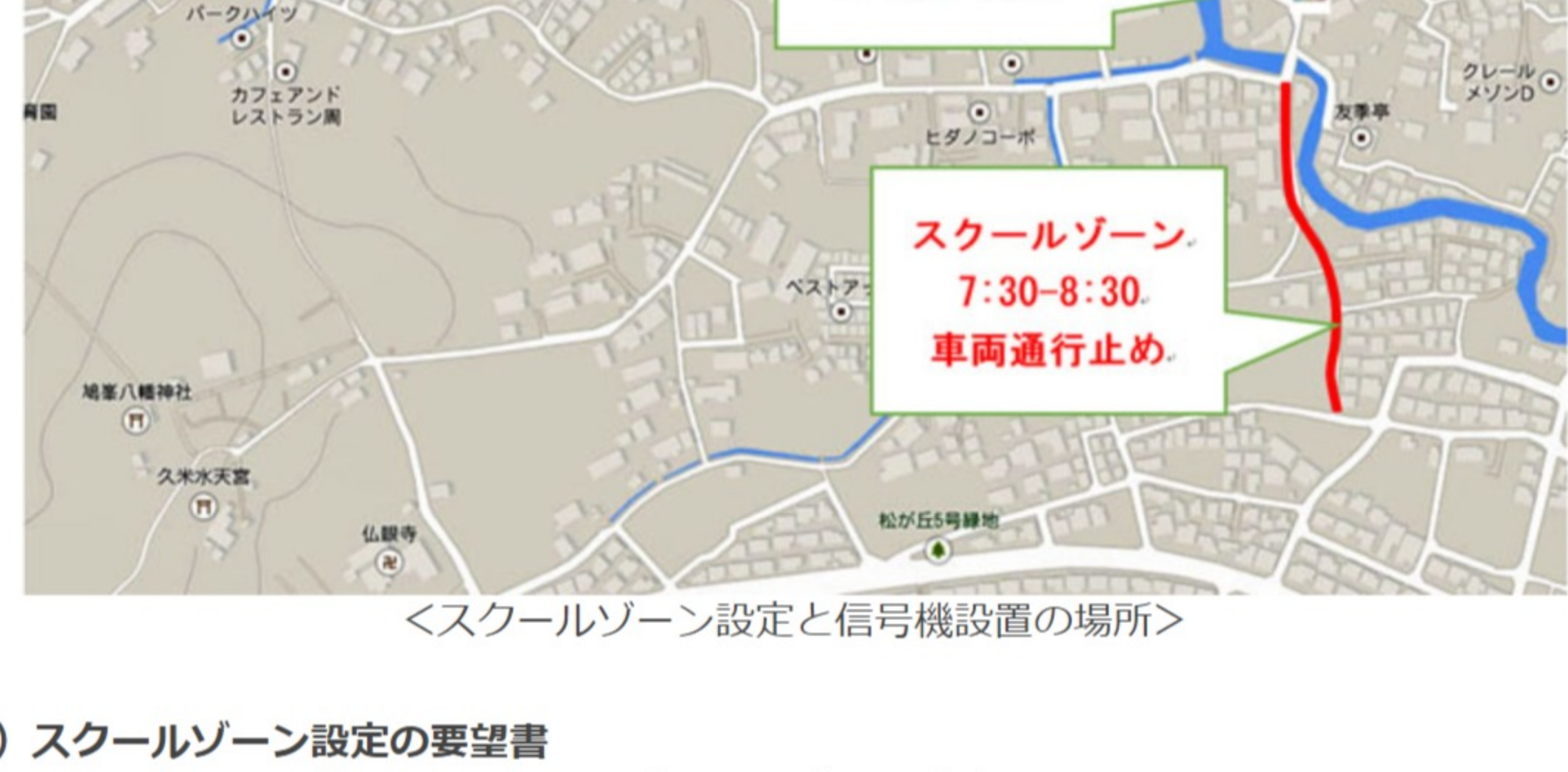
<スクールゾーン設定と信号機設置の場所>

1月9日、住民、学校、PTA、町内会の署名をいただき、所沢市役所と所沢警察署に要望書を提出しました。