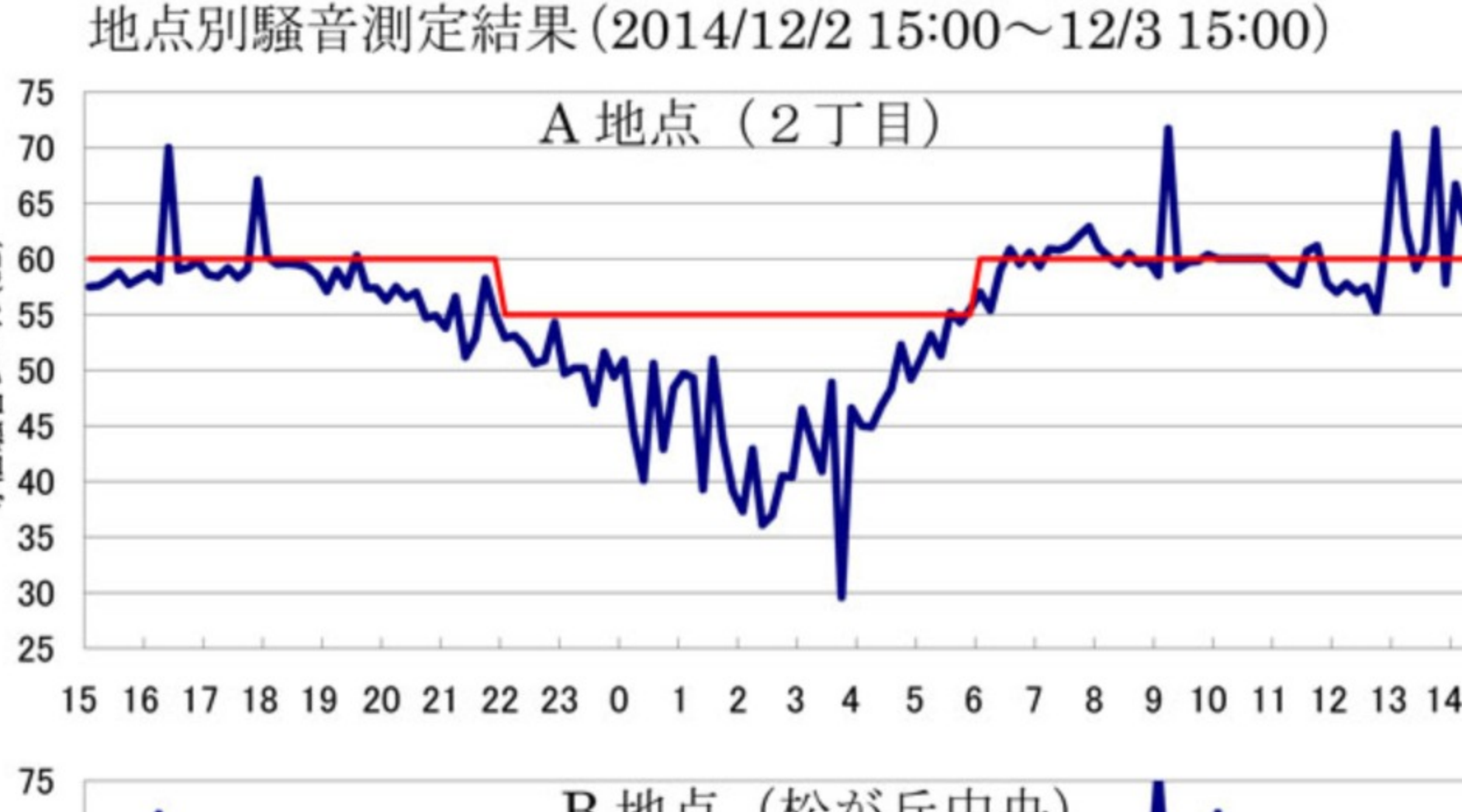
<時間帯別地点別騒音測定結果>