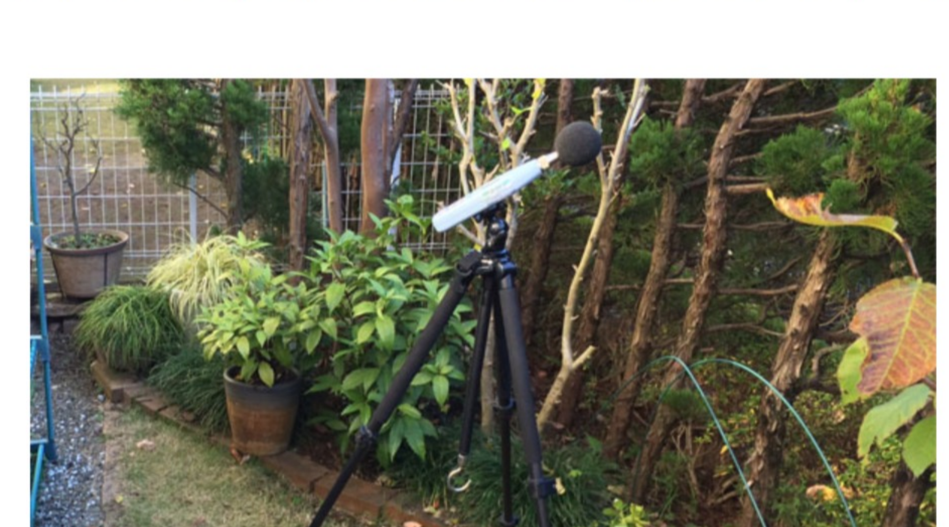
<A地点での騒音調査>