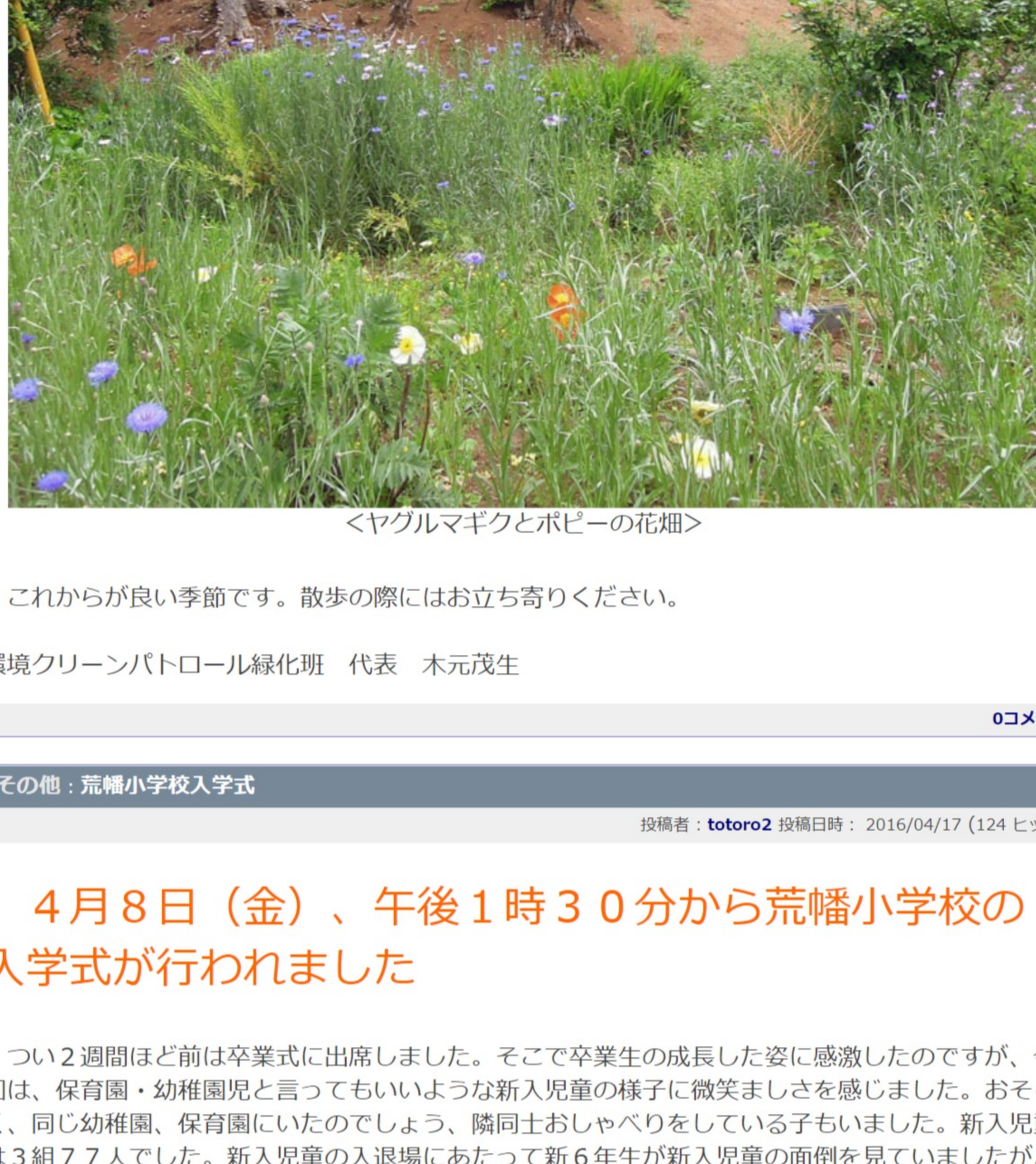
<ヤグルマギクとホピーの花畑>