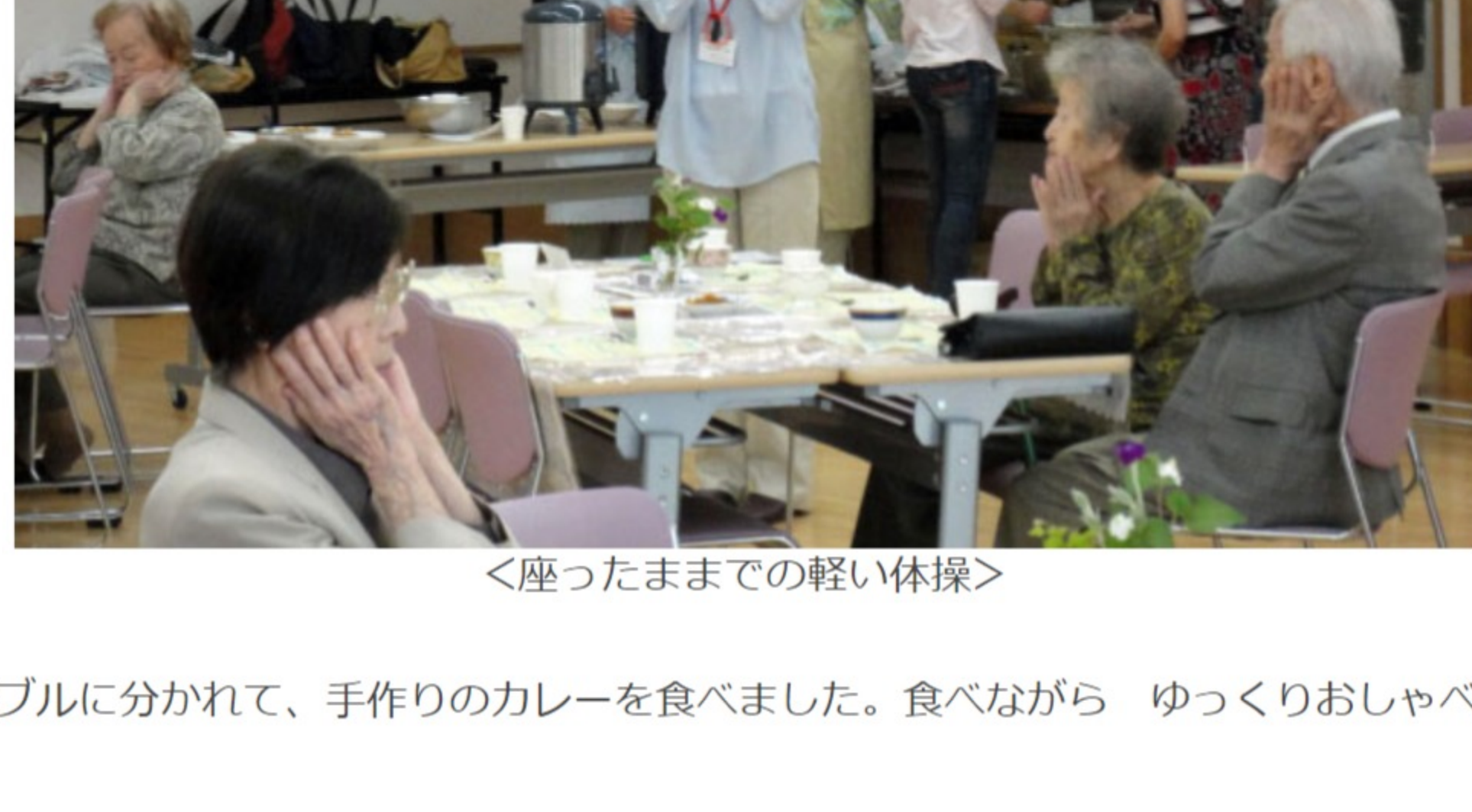
＜座ったままでの軽い体操＞

はじめに、包括支援センターの方から座ったままでの軽い体操で、耳の下を刺激したり、舌の運動などをおそわりました。