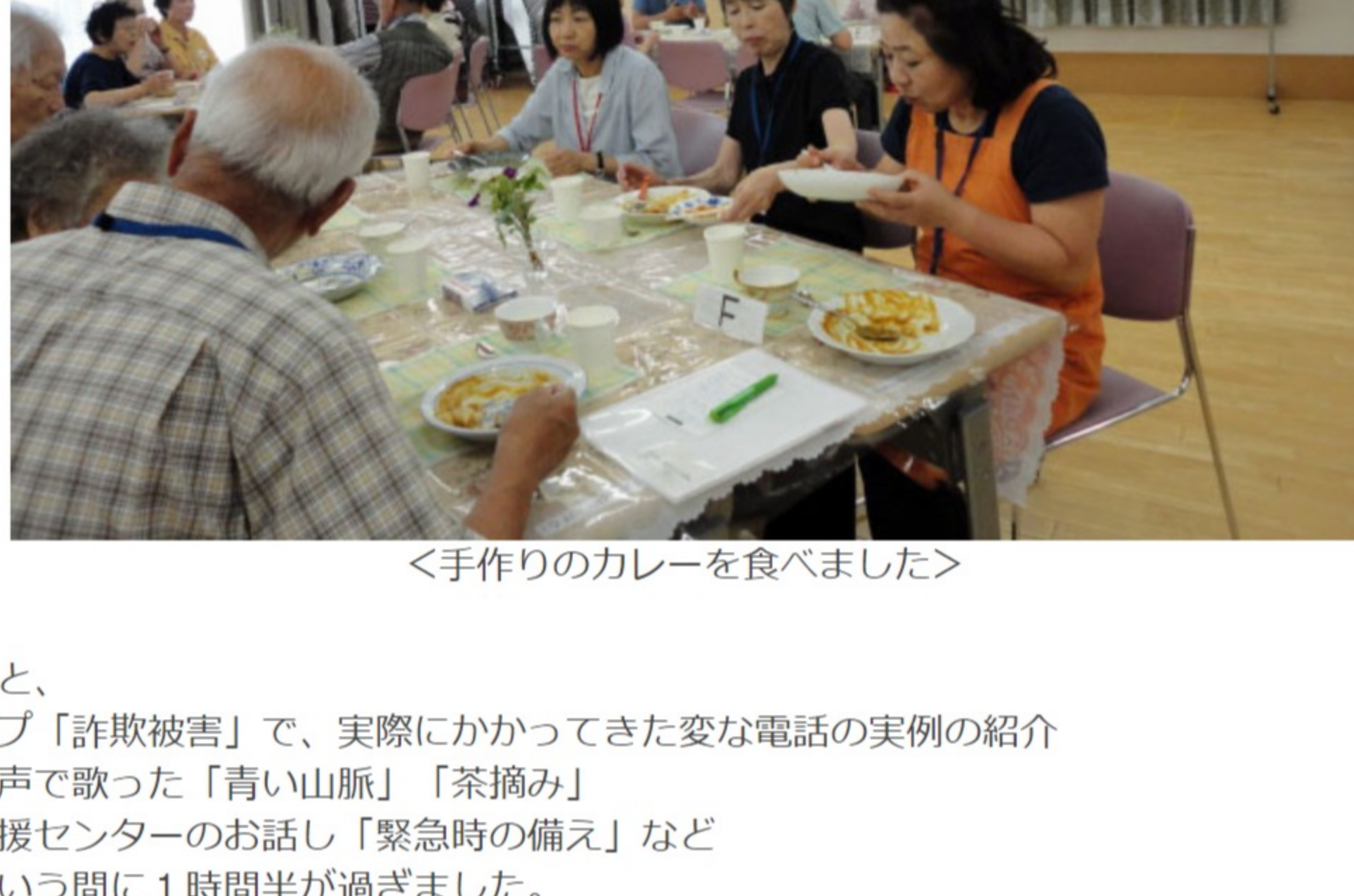
＜手作りのカレーを食べました＞

6テーブルに分かれて、手作りのカレーを食べました。食べながら ゆっくりおしゃべりができました。