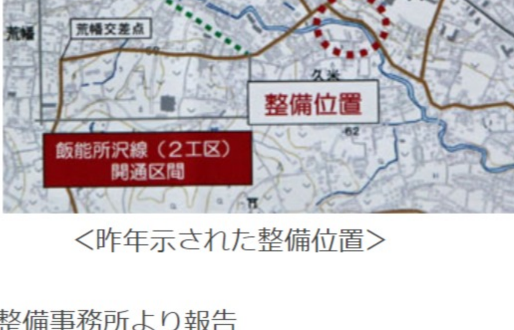
<昨年示された整備位置>

所沢市より報告 ●迂回道路(じゅうにん坂信号交差点から柳瀬川沿い)の歩道整備は、当初の計画より歩道整備範囲を南陵中学下の信号機付交差点まで約2倍の区間に延長する。これは、昨年11月26日に行われた「第4回安全対策の経過報告」会で住民側から出された要望に対応したものだ。 ●南陵中の南側交差点は、歩道整備の支障となる電柱等を移設し、歩道の確保に務める。