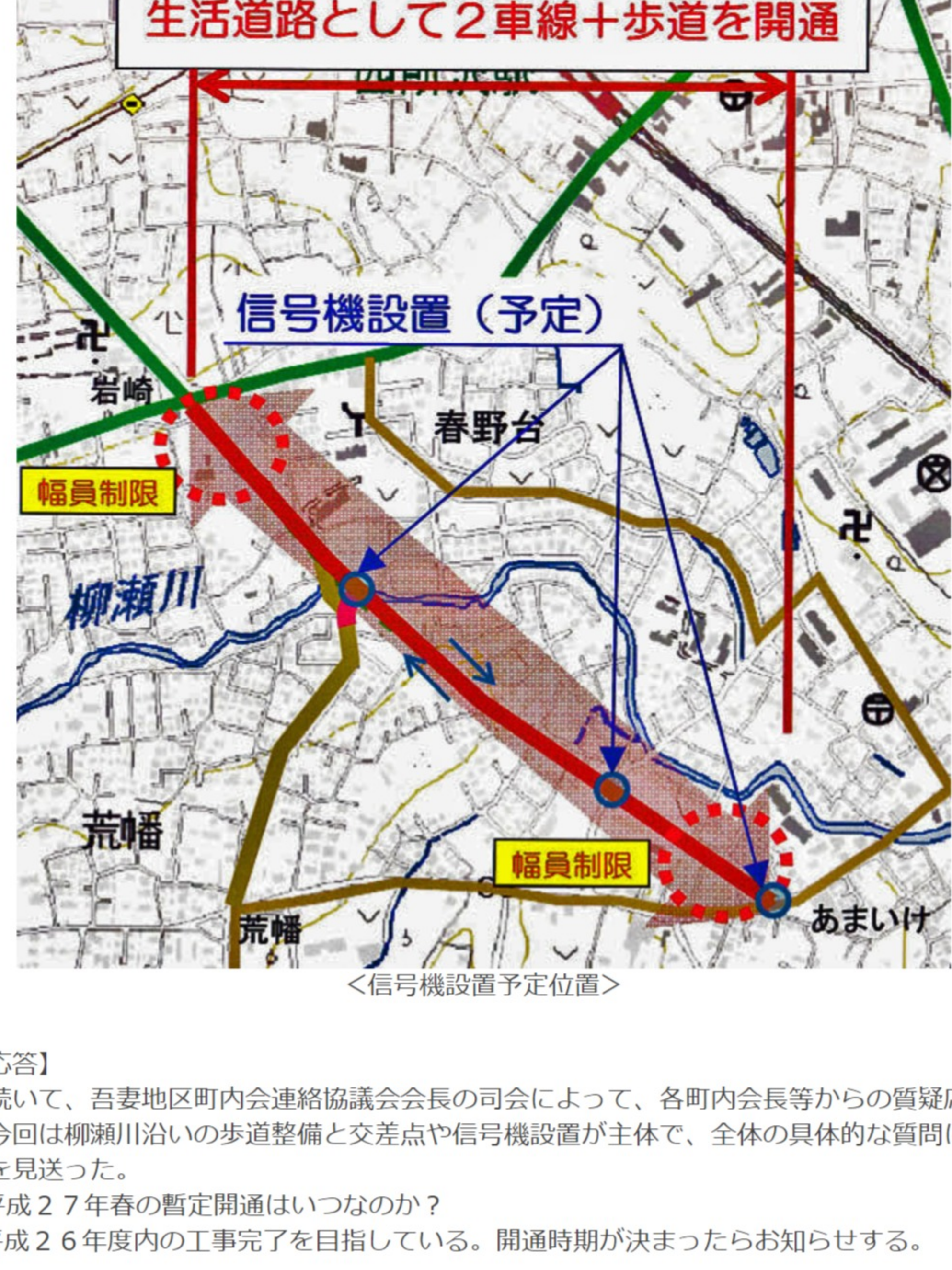
<信号機設置予定位置>

県土整備事務所より報告 ●飯能所沢線(第2工区)の岩崎交差点~あまいけ交差点まで平成27年春の暫定開通では、3箇所の交差点に信号機を設置する予定である。これも、「第4回安全対策の経過報告」会で住民側から出された強い要望に対応したものだ。