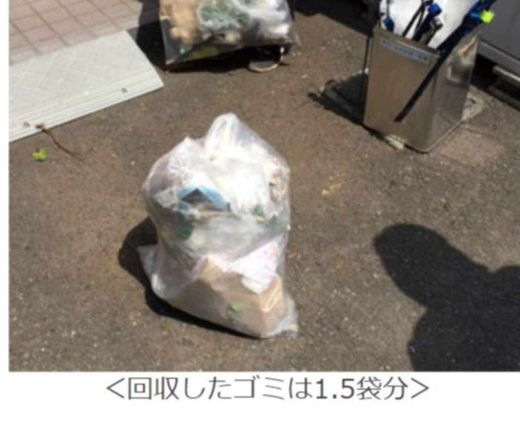
<回収したゴミは1.5袋分>

7月2日(水)は16名の参加で街を清掃した。梅雨の時期、雨のために活動は2回ほど中止になった。しかし、本日の活動で回収したゴミの量は少なく、1.5袋しかなかった。綺麗な街は捨てられるゴミが少なく、それは安全・安心な街に繋がる。