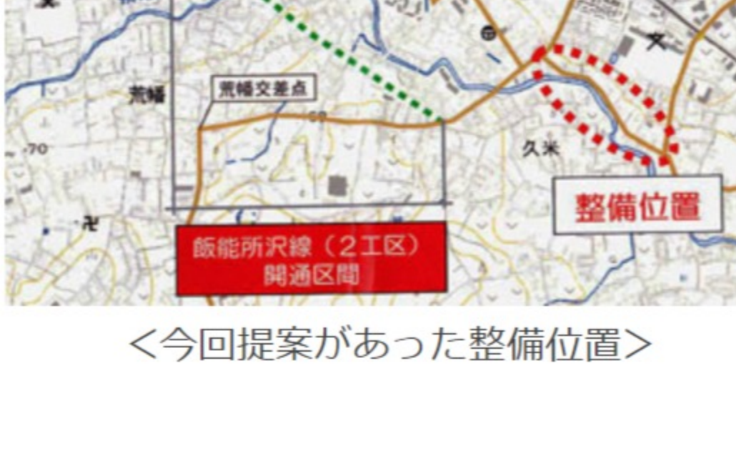
<今回提案があった整備位置>

県土整備事務所より報告 ●飯能所沢線(第2工区)の岩崎交差点~あまいけ交差点まで平成27年春の暫定開通では、3箇所の交差点に信号機を設置する予定である。これも、「第4回安全対策の経過報告」会で住民側から出された強い要望に対応したものだ。