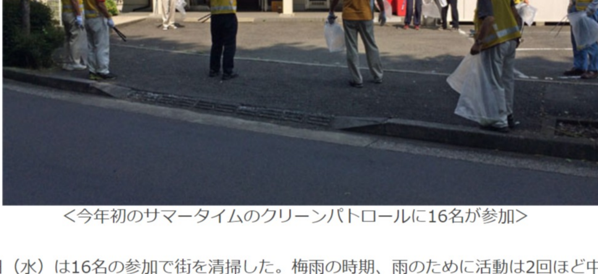
<今年初のサマータイムのクリーンパトロールに16名が参加>

クリーンパトロールでは、夏場の暑い7月と8月はいつもより45分早い9時15分スタートのサマータイムで街の清掃活動をしている。