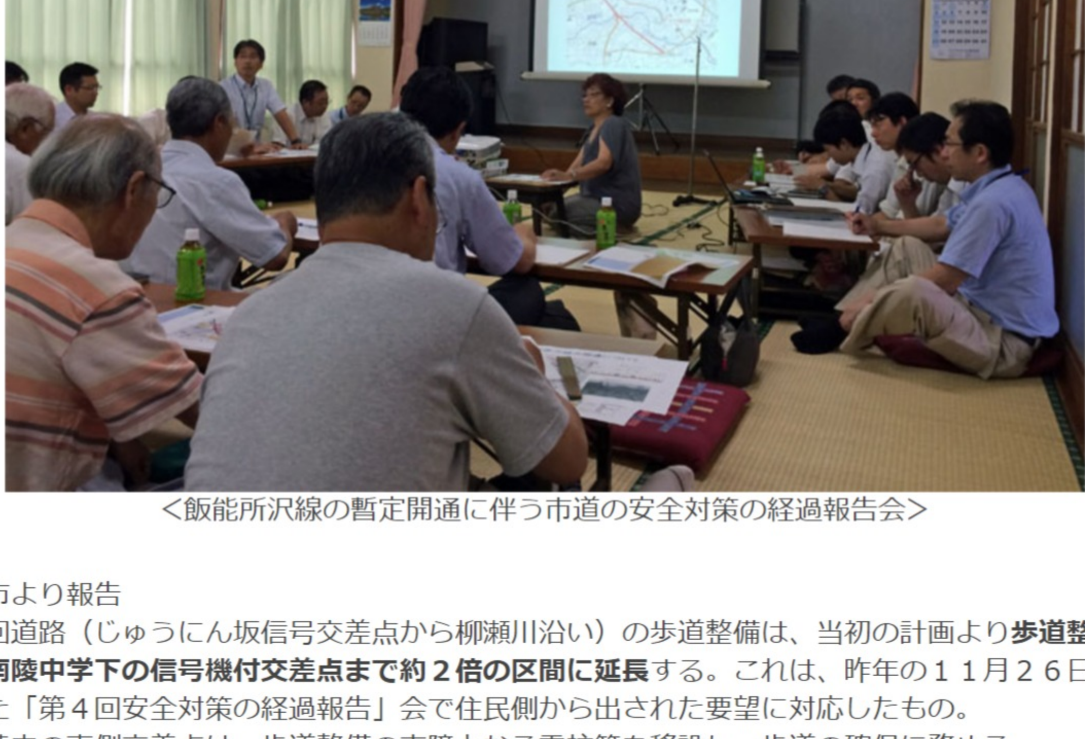
<飯能所沢線の暫定開通に伴う市道の安全対策の経過報告会>

出席者 県土整備事務所、県警本部、所沢警察署、所沢市役所関係者、 県議会議員、所沢市議会議員、 吾妻地区町内会会長、小・中学校長、小・中学校PTA関係者等 (約60名) 日 時 平成27年6月(火) 13:00~15:00 場 所 久米上組集会所