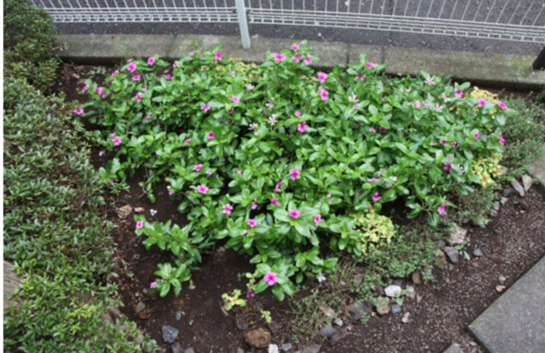
<中央会館前の花壇>

新たな活動として、4月に中央会館前に花壇を作り、バラ、マーガレット等を植えました。7月には、日日草、リシマキアに花壇の植え替えをしました。