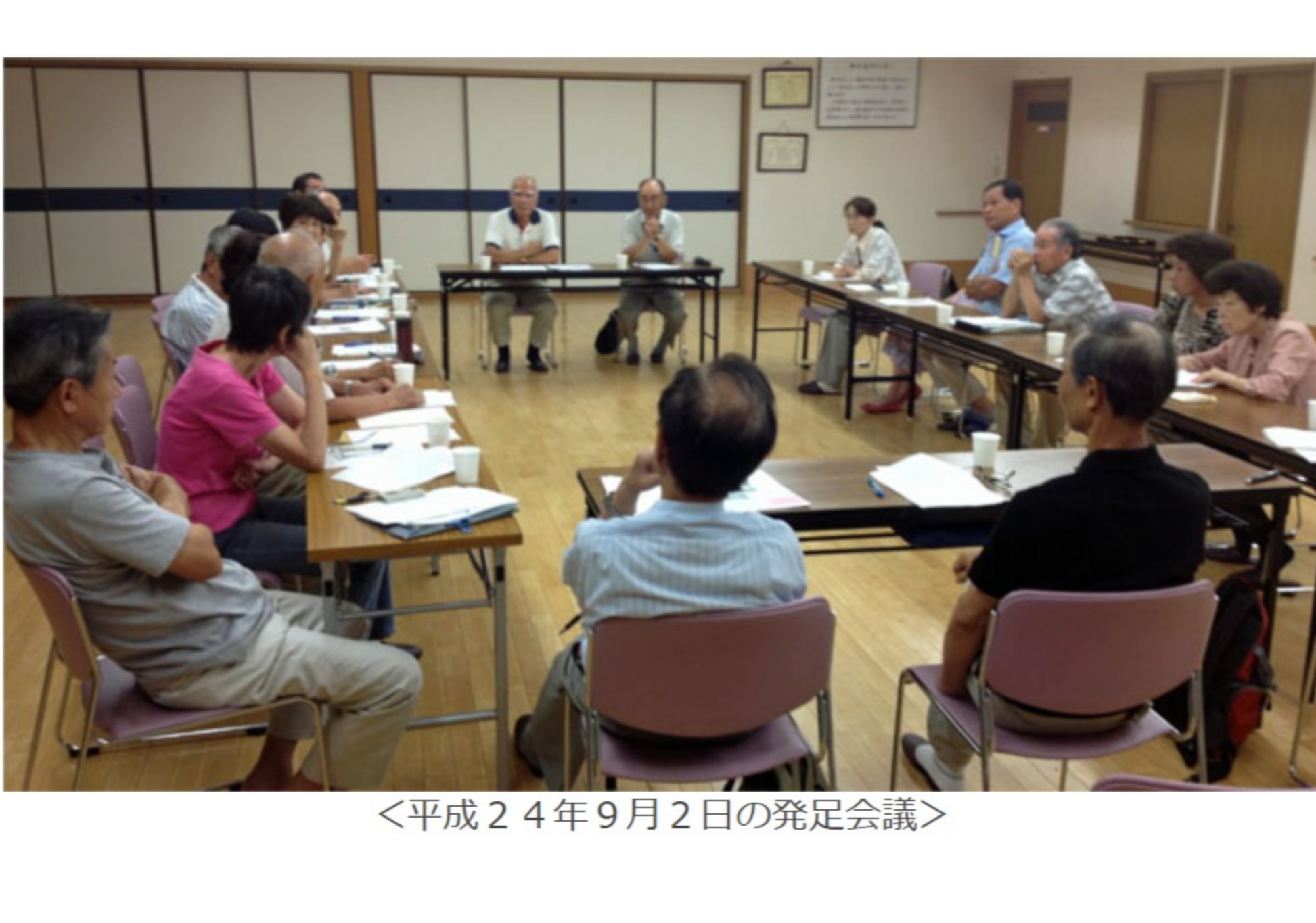
<平成24年9月2日の発足会議>

1. このボランティア活動は 「急速に進む高齢化をふまえて、家庭訪問を活動のベースに、高齢者のみまもり・ふれあい活動に努める」ことを目指します。 なおこの活動は、所沢松が丘自治会の支援によるものです。