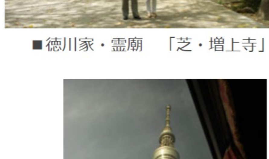
■徳川家・霊廟「芝・増上寺」