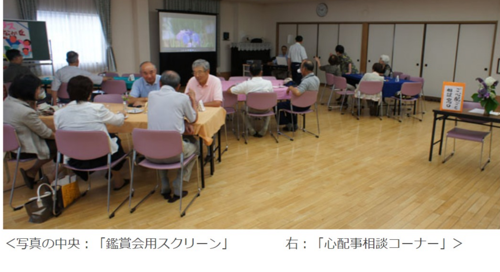
<写真の中央：「鑑賞会用スクリーン」 右：「心配事相談コーナー」>

新たな企画として、介護等の心配事相談コーナーとして、窓口を開設いたしました。ご相談内容についてその場でお答えできるとは言えませんが、困っていることとお聴きして、少しでも心を晴らすことに役立てていただくとお望みです。守秘義務はお願いいたします。ご利用いただけたらありがたいです。