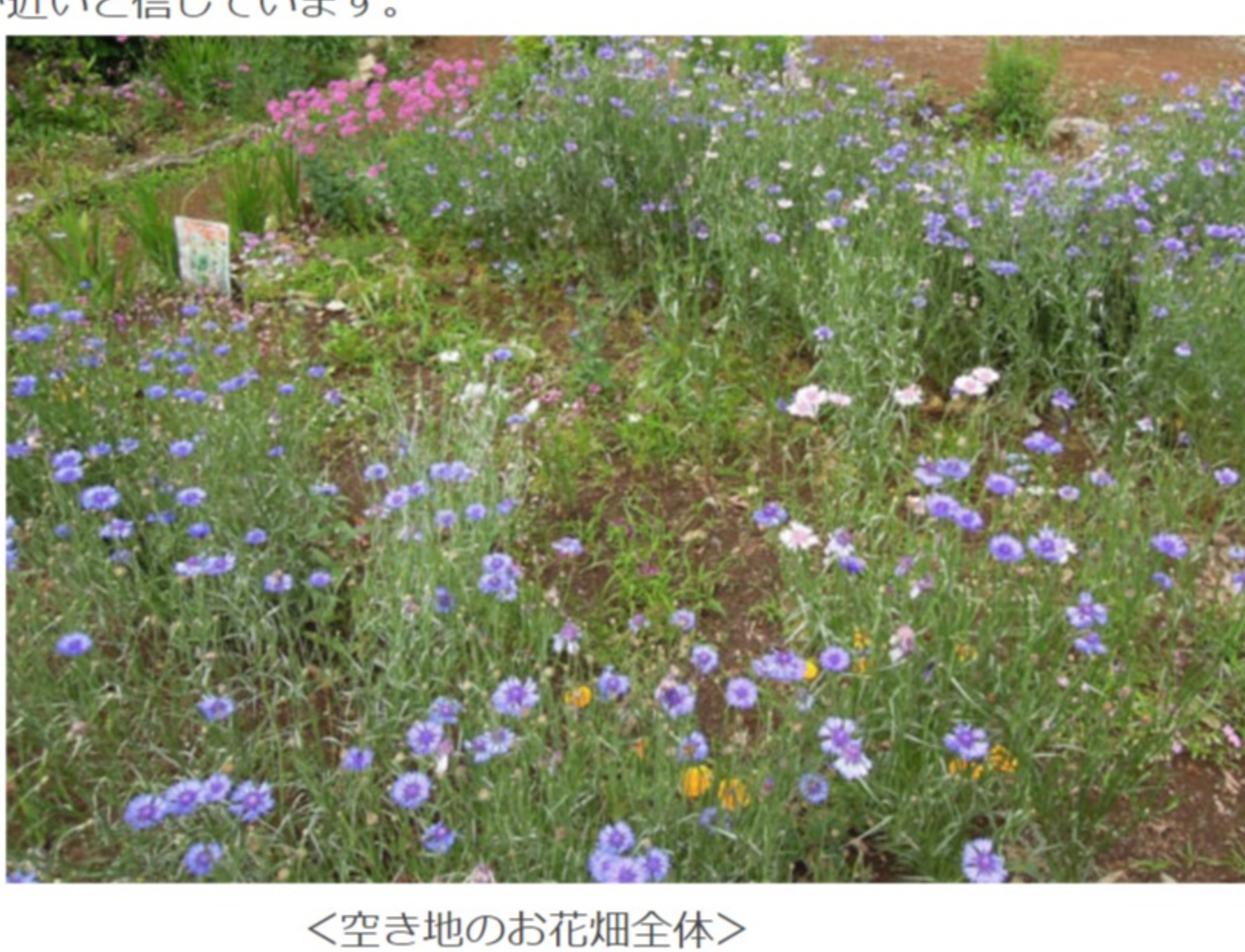
<空き地のお花畑全体>

クリーンパトロール緑化班の頑張りのせいもあってか、空き地(松が丘2丁目43-14番地の市有地)のあちこちに花が咲き、潤い始めてまいりました。もう間もなく「咲き乱れました」と言える日が近いと信じています。