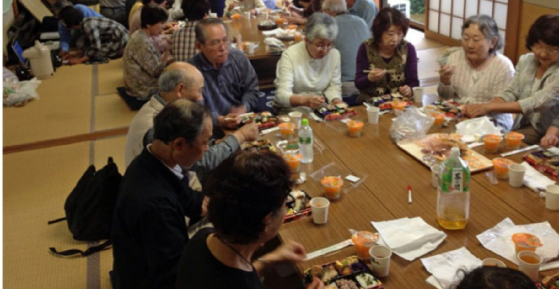
<アメリカ民謡を聞きながら食事を楽しみました>

とても絵が得意な方がいらして、松が丘の絵画を楽しんだ班もあります。知らない人同士が同じテーブルで顔を合わせ、お話が弾んだのは、何よりの収穫だと感じました。