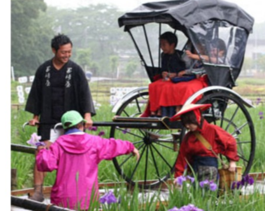
<雨の中、今日から始まった『花菖蒲まつり』>