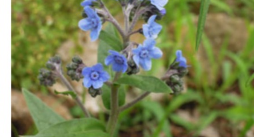
<シナワスレナグサ(アンチューサ)>