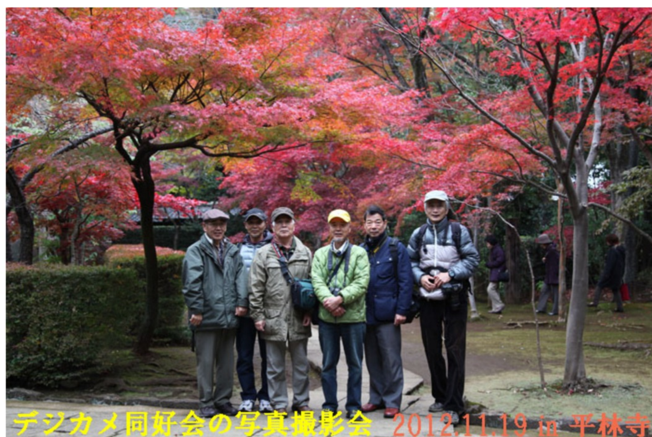
デジカメ同好会の写真撮影会 2012.11.19 in 平林寺

11月19日（月）、デジカメ同好会で紅葉の写真撮影会をしました。場所は、中央会館から車で約30分の距離（約12km）にある平林寺です。平林寺は、禅修行の専門道場をもつ関東の代表的な臨済宗妙心寺派の禅刹です。武蔵野の面影を残す13万坪の境内林は国指定天然記念物になり、モミジ等の紅葉は素晴らしいものです。