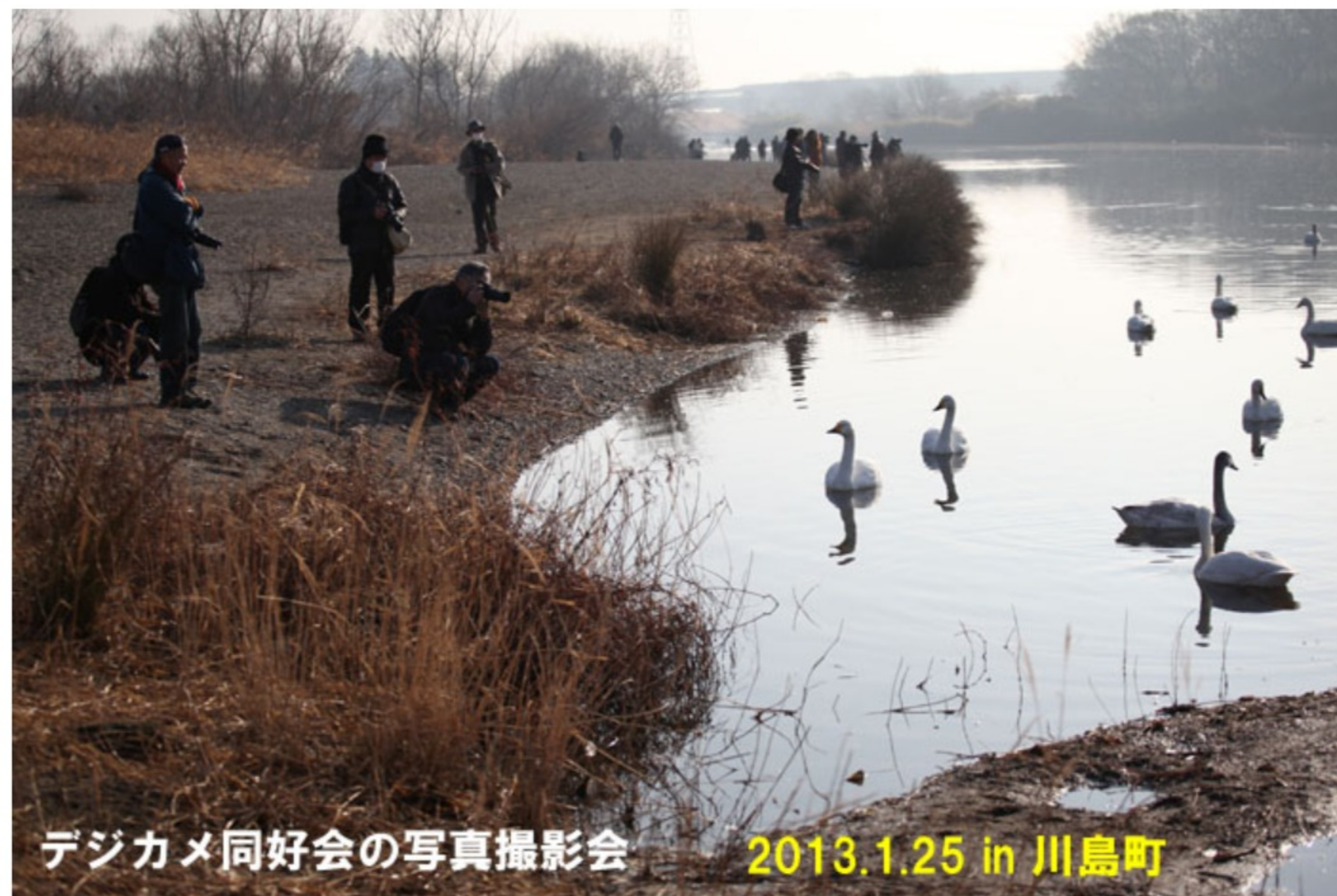
デジカメ同好会の写真撮影会 2013.1.25 in 川島町

1月25日（金）、デジカメ同好会で白鳥の写真撮影会をしました。場所は、中央会館から車で約50分の距離（約40km）にある川島町の越辺川河川敷です。毎年多くの白鳥が飛来し、この時期は絶好の白鳥撮影ポイントとなるところです。今日の飛来した白鳥は約190羽だそうです。