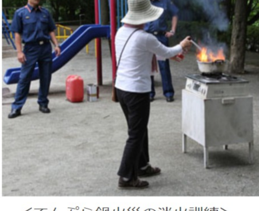
<てんぷら鍋火災の消火訓練>

実際の消火器に触れるのは初めてという参加者もいらっしゃいましたが、今回の参加で大いに自信をもたれたのではないのでしょうか。参加者は50名前後と予想より少なかったのですが、参加したことにより何かを得て頂けたら主催者としては嬉しい限りです。