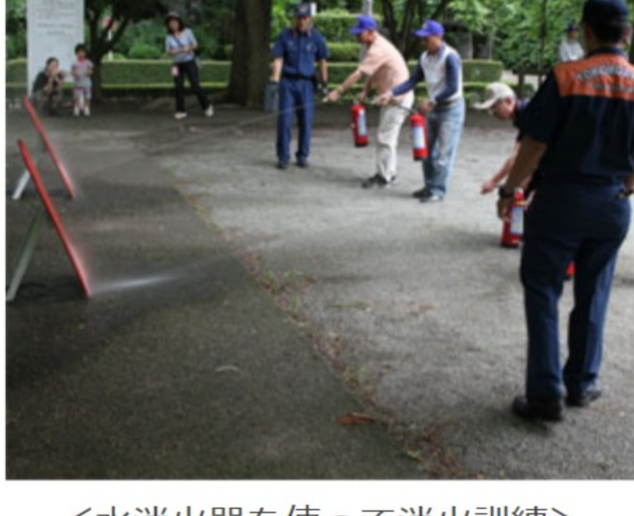
<水消火器を使って消火訓練>

9月1日(土)には所沢市主催の総合防災訓練が予定されています。できるだけ多くの会員の皆さんが参加くださるよう期待しております。