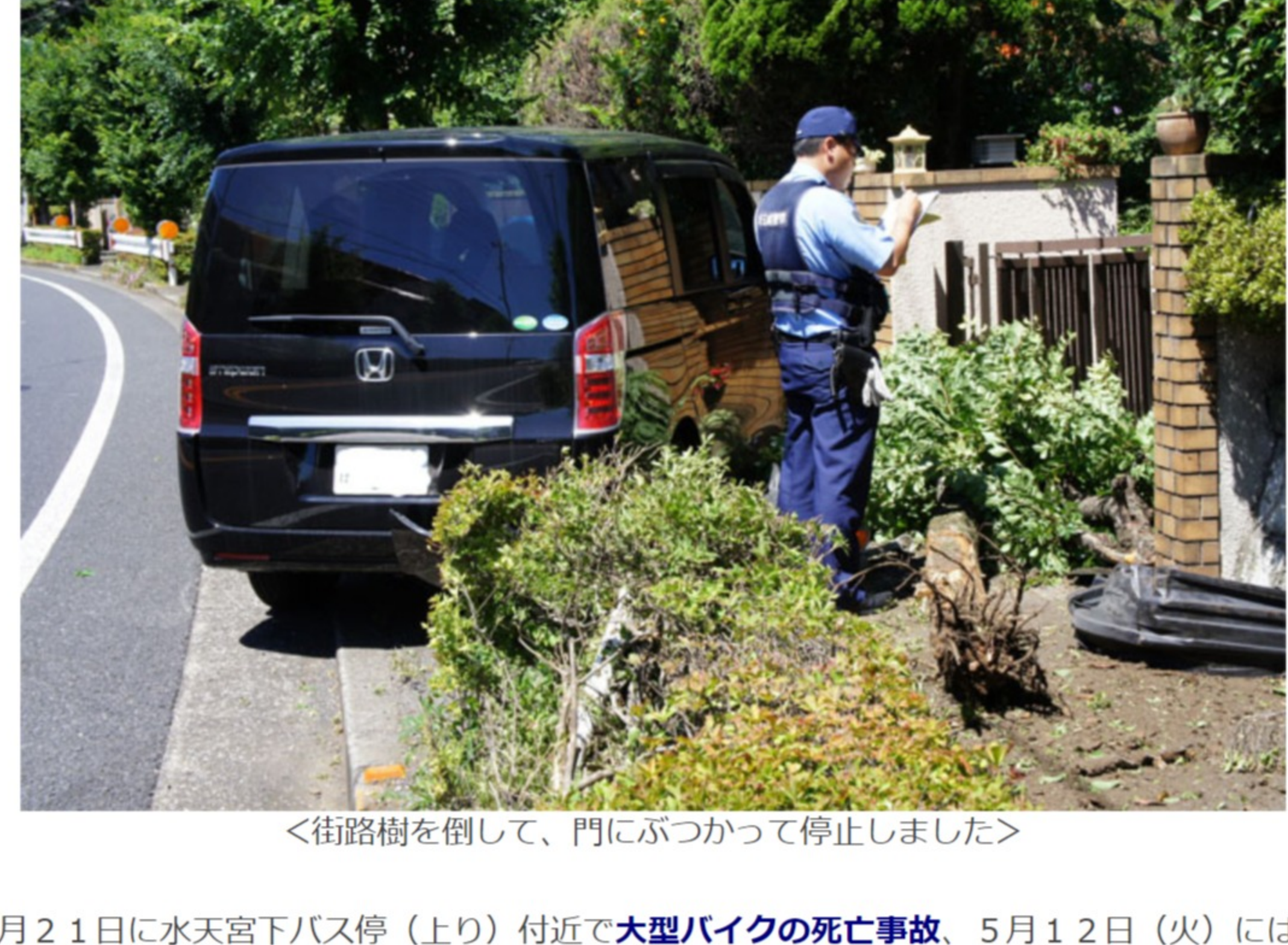
<街路樹を倒して、門にぶつかって停止しました>

6月21日に水天宮下バス停(上り)付近で 大型バイクの死亡事故 、5月12日(火)には水天宮下バス停(下り)付近で 自損事故 があったばかりです。