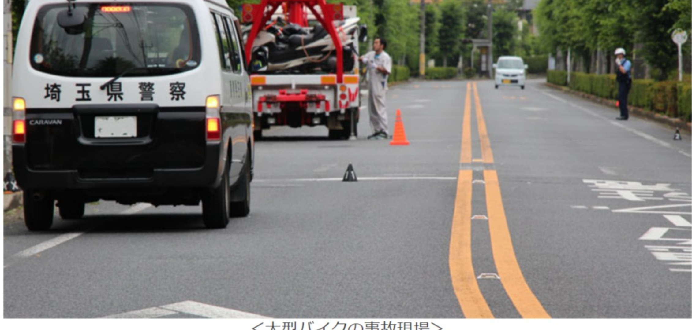
<大型バイクの事故現場>